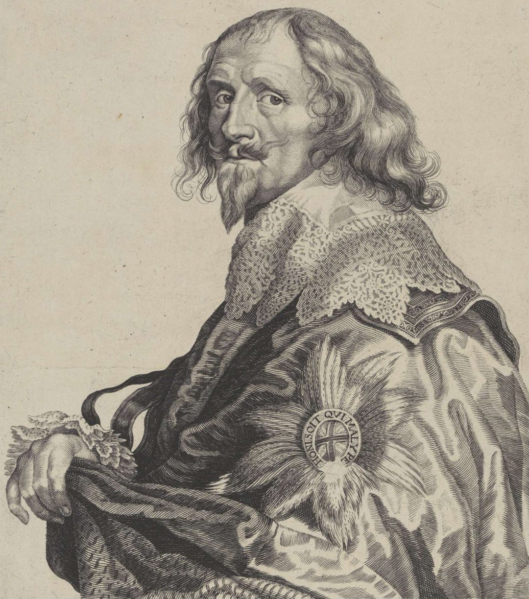
PHILIPPVS HERIBERTVS COMES DE PENBROKE ET MONGOMERY, BARO DE CARDIFFE ET SHIRLAND, D. ns DE PARRE ET ROOS IN KENDALL, MARCHIO S. ti QVINTI, REGIS ANGLIÆ A CVBICVLIS EQVES PERISCCELIDIS.