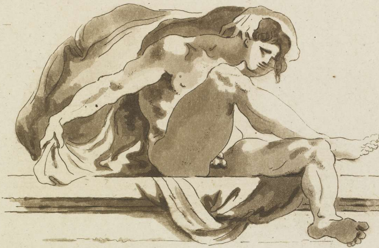
Pellegrino Tibaldi Palais des instituteurs à Sologne