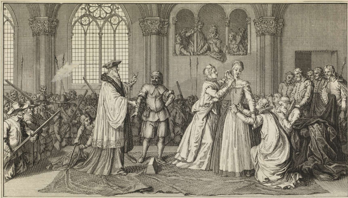
MARIE STUART Reine d'Ecosse décapitée le 8 me février 1587. dans le Chateau de Fotheringhey, sous le Regne d' ELISABETH Reine d'Angleterre.