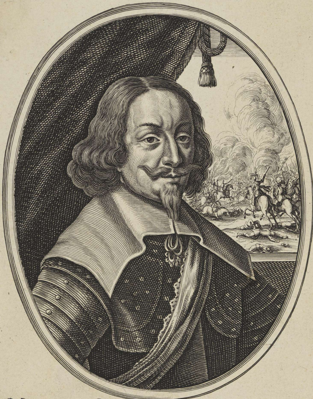
MATTHIAS CONTE DE GALLAS CONSEILER ET CHAMBELAN DV ROY D'HONGRIE ET GENERAL DANS SES ARMEES.