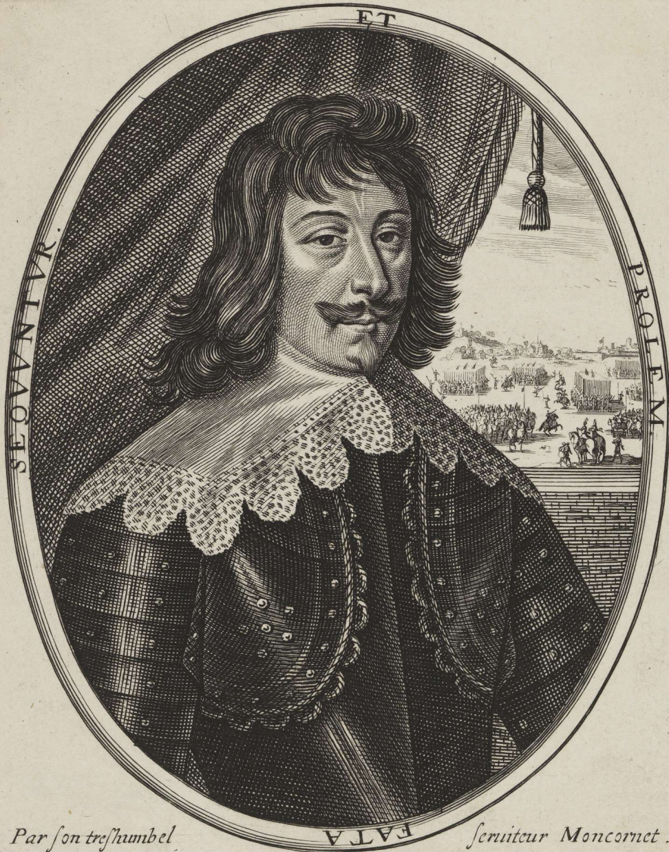
Par son tres humble Manasses, Comte de Pas seig r de Feuquiere etc general des armées de sa Maies te mort de ses blessures a T h ionville. en la 50 e année de son aage a mesme iour que son Pere premier Chambellan de Henry le grand fut tué a la Bataille diuri, faisant la change de Mar al de camp FATA seruiteur Moncornet.