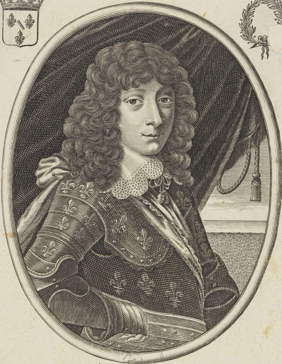
MONSEIGNEUR ARMAND DE BOVRBON PRINCE De Conty Abbe' de S t Dennis en France, et Gouverneur Pour Sa Maie te Des Pais et Contes de Champagne. &c.