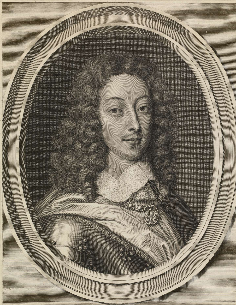
CHARLES II. DUC DE MANTOUE. ET DE MONTFERRAT. NIVERNOIS. RETHELOIS. ET MAYENNE. PAIR DE FRANCE. PRINCE SOVERAIN D'ARCHES. ET DE CHARLEVILLE