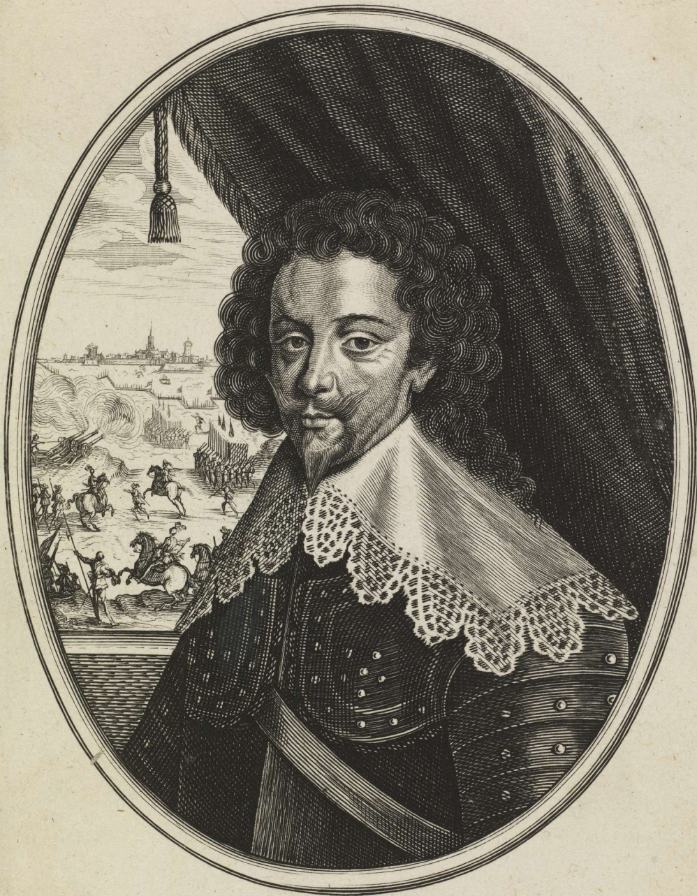
CHARLES, MARQUIS D'ALBERT. Duc de Luynes, Pair, Connétable, et Grand Fauconnier de France Gouverneur et Lieutenant General pour le Roy Picardie.