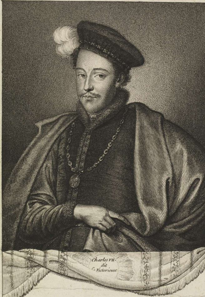
Charles VII. dit C. Victorieux

De mes plaisirs la fatale influence Des Français étonnés suspend trop la Valeur , Je m'veille ; Albion, connois donc ma puissance ; Et toi, mon Peuple, un Père, et toi France, un Vengeur .