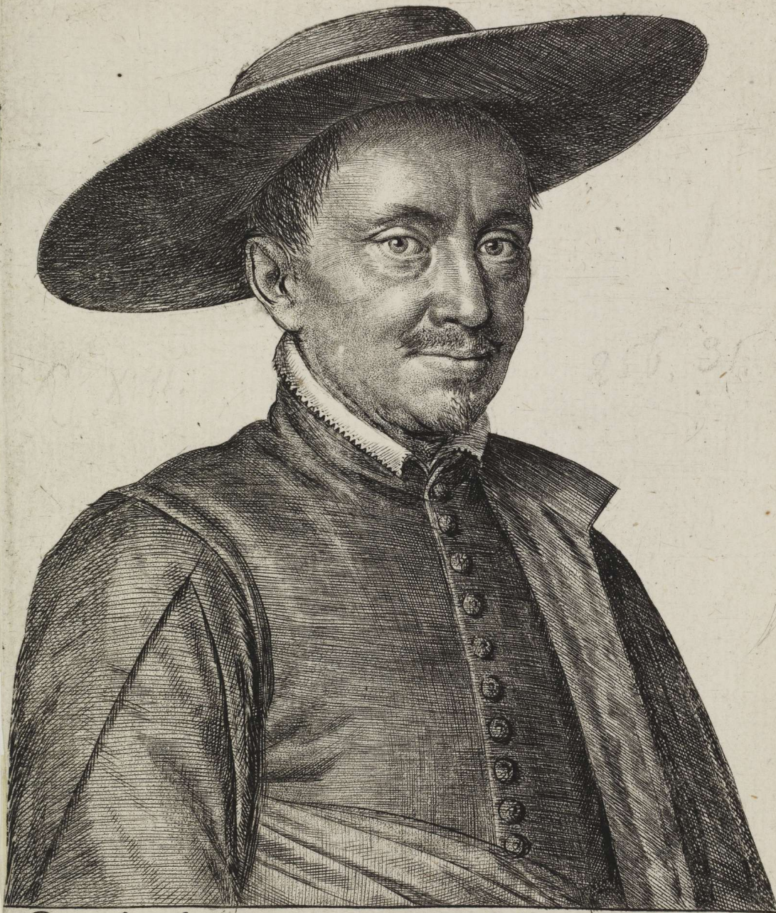
Raphael Menicuccius Celeberrimus in vtroq[ue] Orbe Terrarum Romæ 1625. Ott. L. f.