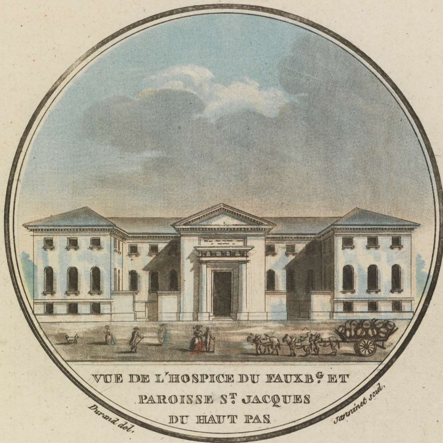
VUE DE L'HOSPICE DU FAUXB G ET PAROISSE S T JACQUES DU HAUT PAS