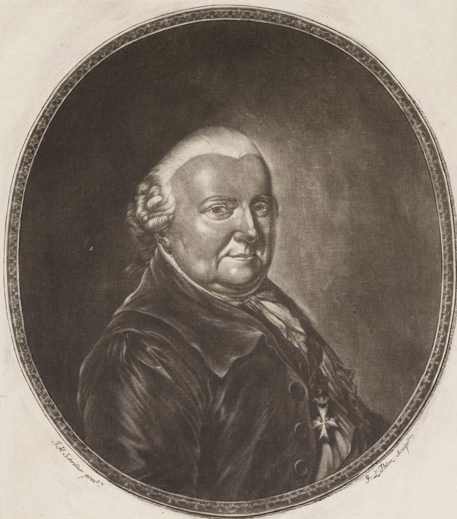
FERDINAND Duc de Brunswick et de Lunebourg