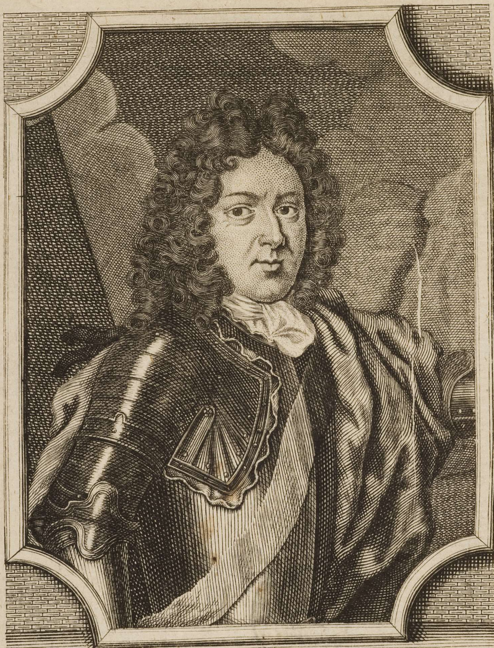
Herzog von Maine Königs Ludovici XIV. natürlicher Printz von der Mad. de la Valiere.