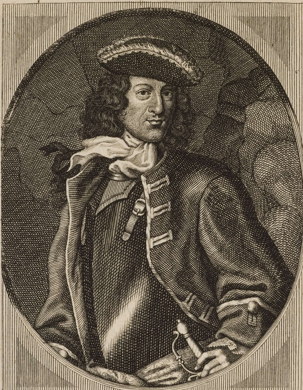
Marquis de Langalerie.