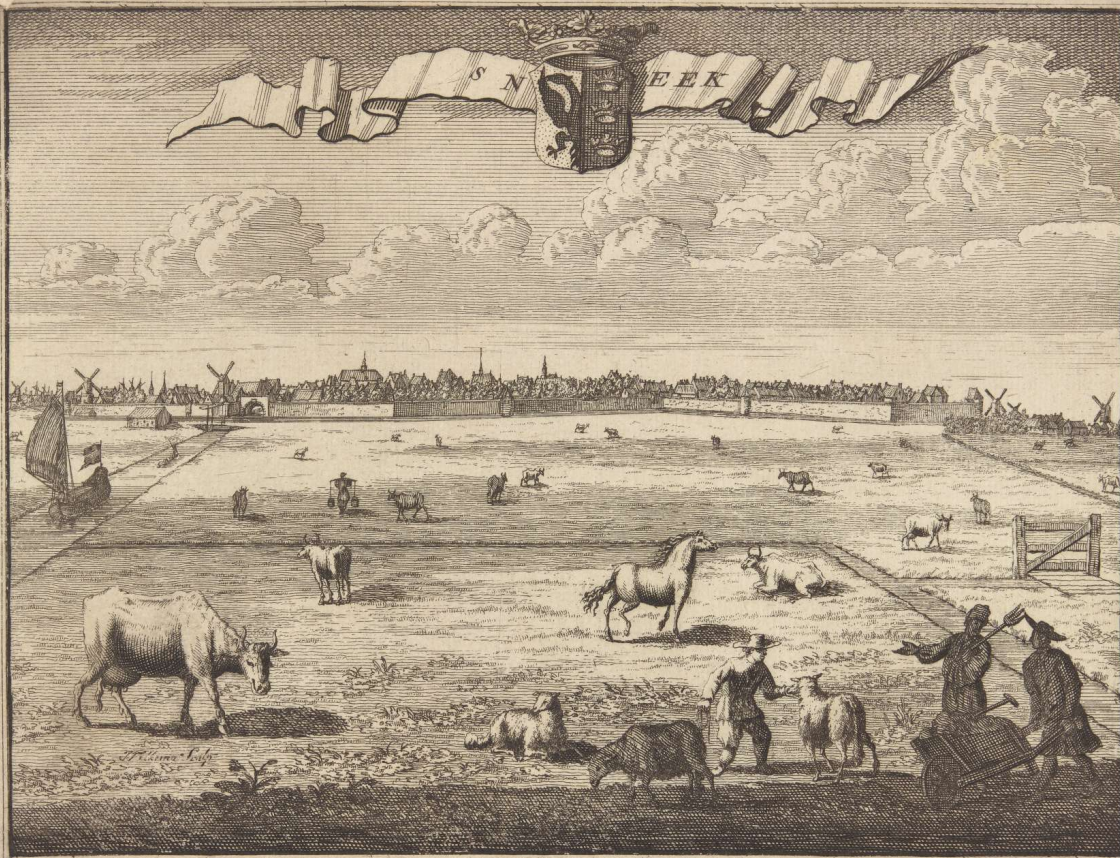
S N E E K een Stad in Friesland in Westergo, 2½ uur (c) van Bolsward en vier en 8 z w van Leeuwerden A. Allard exc. c. Print