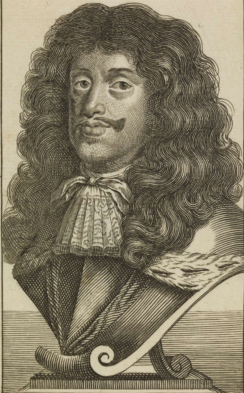
L' EMPEREUR LEOPOLD. I.