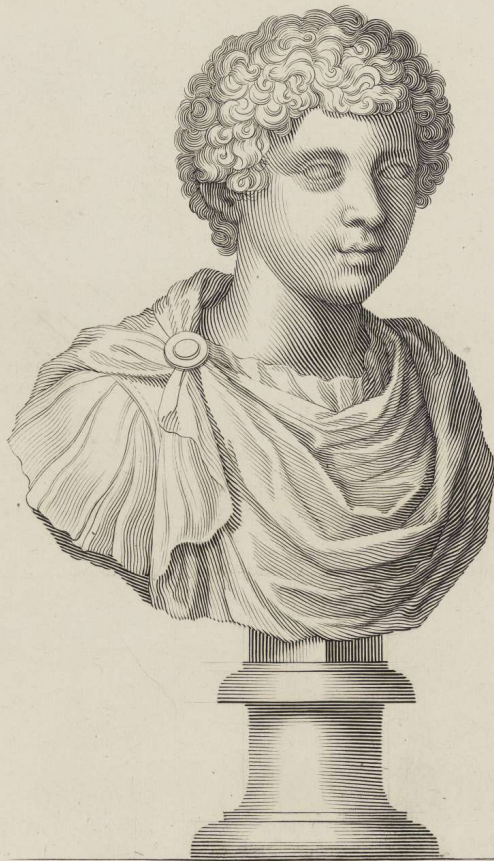
Buste antique de marbre du Jeune Geta— au Palais des Thuilleries.