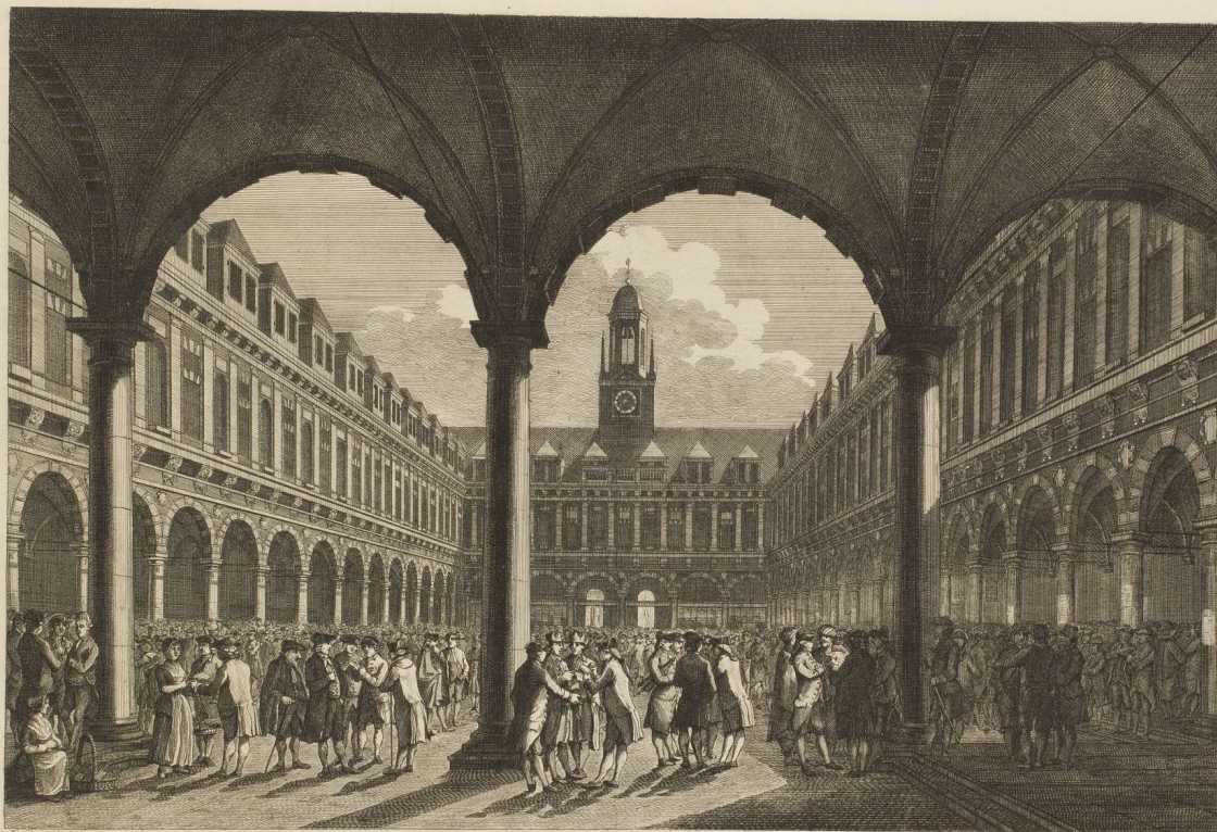
GEZICHT van de BEURS, te Amsterdam.