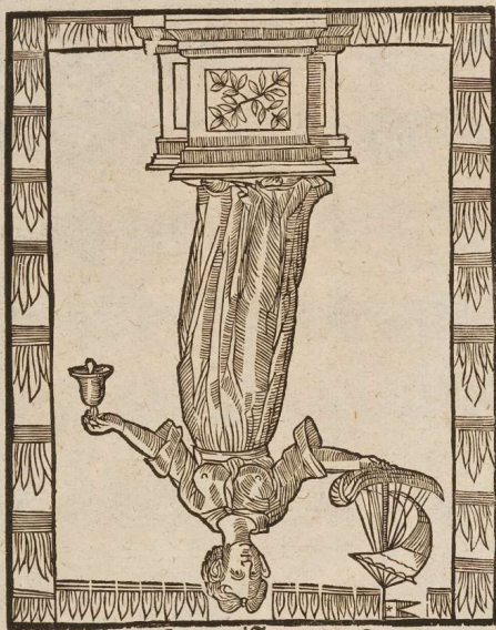
Die Göttin Thetis Pag. 85.