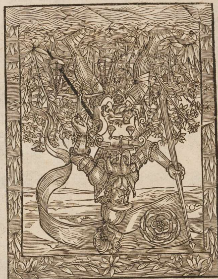
Der Abgott Mars Pag. 84.