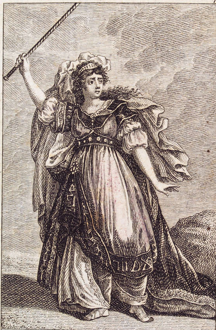
Idealische Kleidung. M lle Raucourt als Medea.